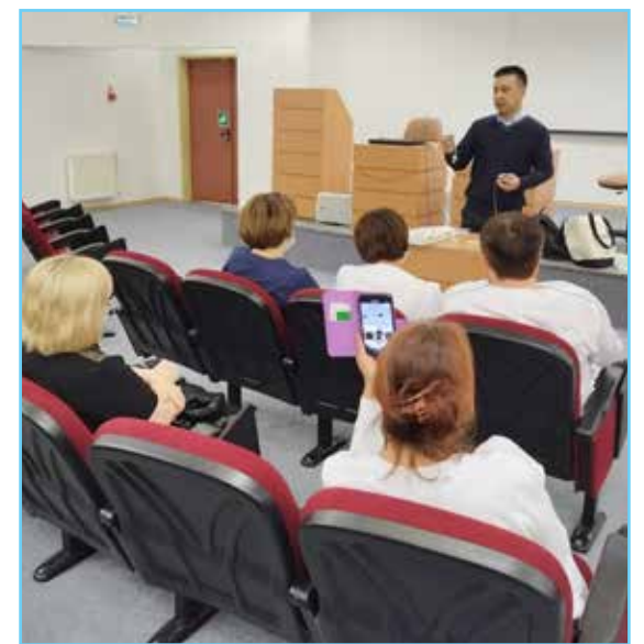
Школа паллиативной помощи для родителей и медицинских специалистов

ятельности Нижневартовской окружной клинической детской больницы. – Общепринятого перечня заболеваний, требующих оказания паллиативной медицинской помощи, не существует. Решение о нуждаемости ребенка в паллиативной помощи основано в большей степени на его потребностях, а не на установленном диагнозе.