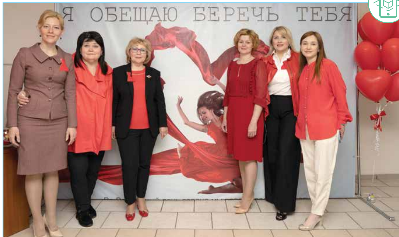
Гости и организаторы акции

В женской консультации Нижневартовской городской поликлиники прошла пятая юбилейная акция «Красное платье – сердце женщины».