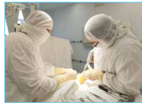
Использование специального силового оборудования в травматологии и ортопедии существенно влияет на результат, делает работу врачей более эффективной

Обновление инструментов для травматологии и ортопедии в Когалымской городской больнице