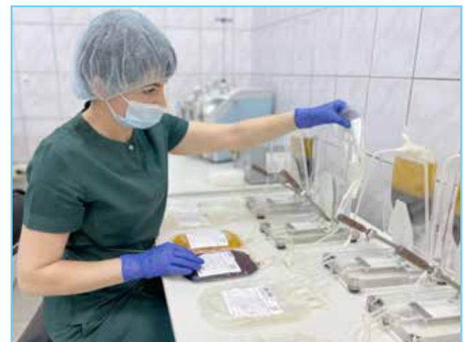
Работа требует внимательности и ответственности