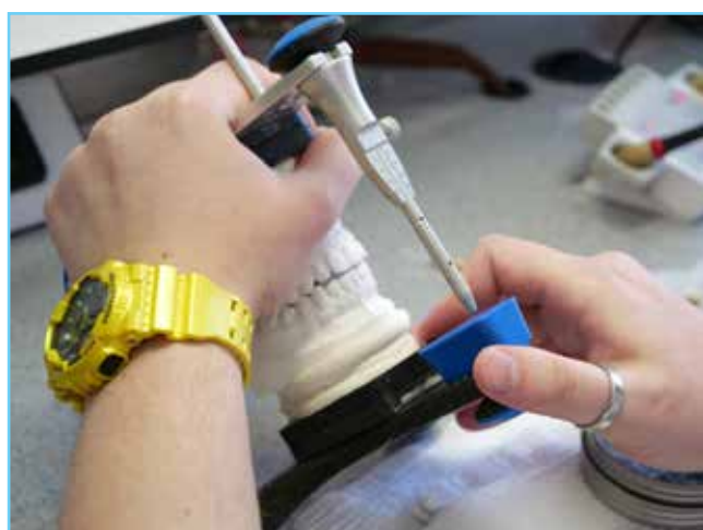
Зубные техники из Югры соревновались в чемпионате профмастерства