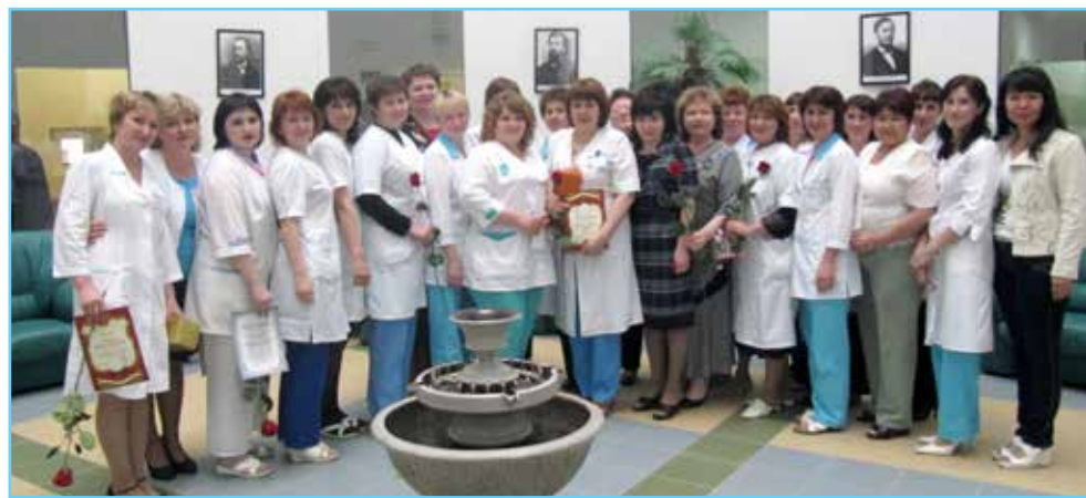
Коллектив Нижнесортымской участковой больницы

Приобретено новое медицинское оборудование, которое позволяет повысить качество оказания медицинской помощи и своевременно диагностировать заболевания или патологические состояния у пациентов: ультразвуковой сканер экспертного класса, 2 дефибриллятора, гематологический и мочевой анализаторы, аппарат ЭКГ, аппарат рентгенодиагностический, маммографический аппарат, флюорограф малодозовый цифровой.