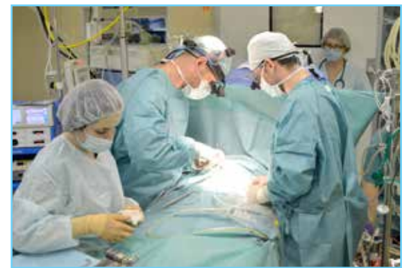
Ежегодно врачи Кардиодиспансера выполняют около 100 операций на сердце детям. При критических пороках хирургическая помощь требуется в первые дни, а то и часы жизни малышей

Врачи Кардиоцентра впервые в Югре провели операцию ребенку с использованием гомографта – протеза, который состоит из фрагментов сердца донора.