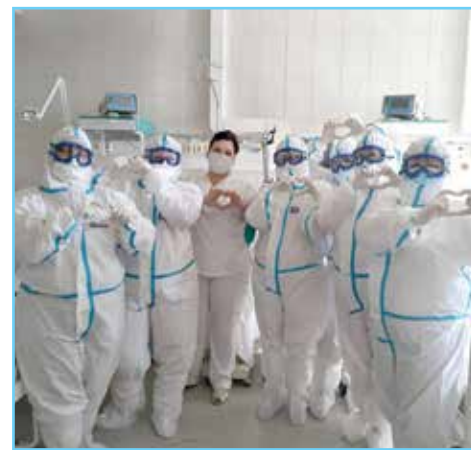
Во время пандемии в 2021 году