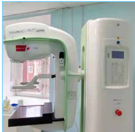
Цифровой аппарат «Маммо-4МТ-Плюс»

Напомним, в рамках реализации региональной программы модернизации первичного звена в Октябрьском районе продолжаются капитальные ремонты и