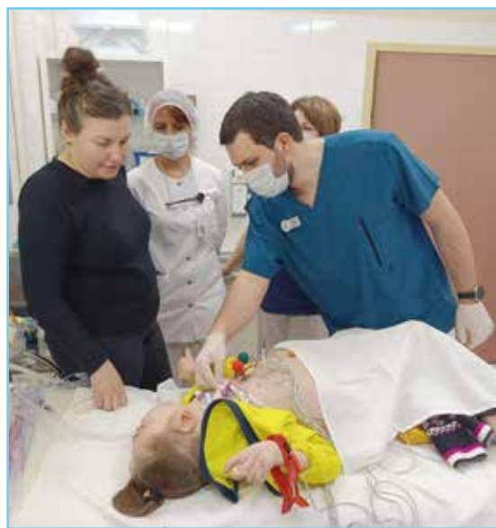
Консультация родителей и замена трахеостомы