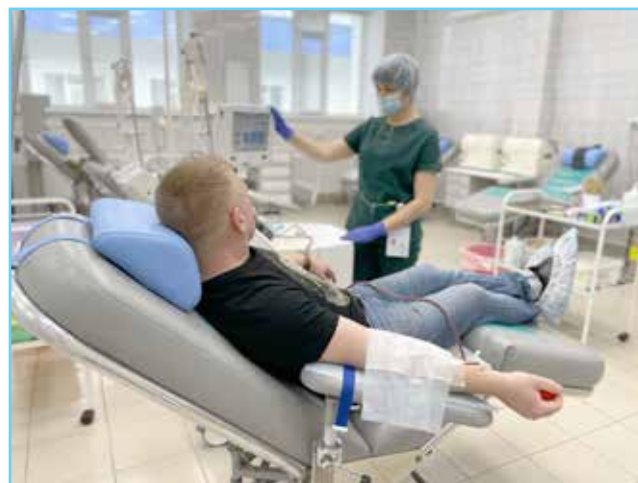
«Я благодарна тому, что я врач!»