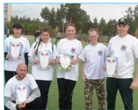
Медики – это спорт и здоровый образ жизни

шер курировал организацию медицинской помощи коренным малочисленным народам Севера. Была организована фельдшерская бригада скорой медицинской помощи.