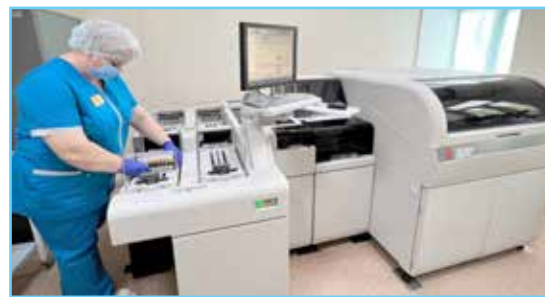
Аппараты лабораторной диагностики уже в работе

Три аппарата лабораторной диагностики, один иммуногематологический анализатор и два для проведения биохимических анализов, поступили в Нефтеюганскую окружную клиническую больницу.