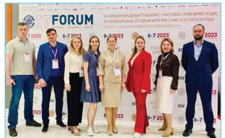
Представители окружного здравоохранения на IT-форуме

Что касается применения искусственного интеллекта в диагностике, скрининговых диагностических исследованиях, для помощи в анализе качества диагностических изображений, то он может быть применен в маммографии, рентгенологии, ранней диагностике у новорожденных. Кроме того, отмечают специалисты, внедрение новых технологий даст возможность снять с врачей часть обязанностей, позволит осваивать новые функции, а значит – учиться.