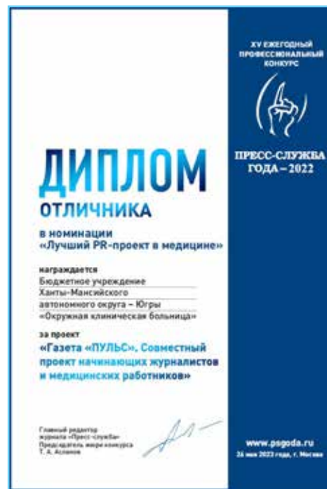
Газета «Пульс» ОКБ Ханты-Мансийска – «Отличник конкурса»

Организаторы XV ежегодного профессионального конкурса «Пресс-служба года» наградили лучших PR-специалистов.