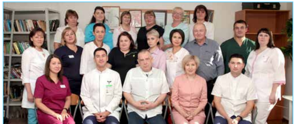
Коллектив наркологического отделения

Долгие годы восстановить здоровье, снять последствия пагубных привычек няганцам с зависимостями врачи и медицинские сестры помогали в деревянном зда-