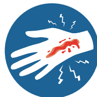
ДЛЯ ОТКРЫТЫХ ПЕРЕЛОМОВ ХАРАКТЕРНО КРОВОТЕЧЕНИЕ, НАЛИЧИЕ КОСТНЫХ ОТЛОМКОВ В РАНЕ