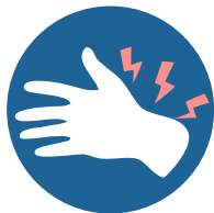
ЛЕГКАЯ БОЛЬ ПРИ ДВИЖЕНИИ

Если боль долго не проходит, обязательно обратитесь к врачу!