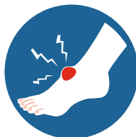
БЫСТРО НАРАСТАЮЩИЙ ОТЕК В МЕСТЕ ПОВРЕЖДЕНИЯ