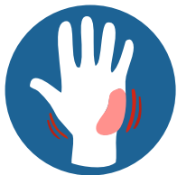
ПРИПУХЛОСТЬ И ГЕМАТОМА